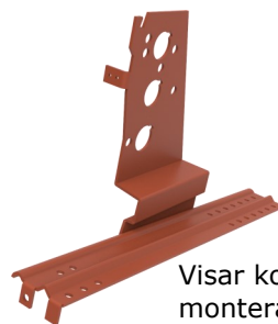
Visar konsol 6030 (btg) monterad på fotplatta 6132 (bärläkt)