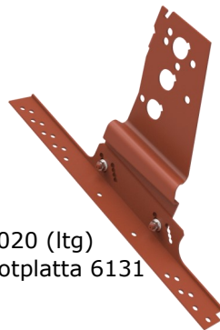
Visar konsol 6020 (ltg) monterad på fotplatta 6131 (råspont)