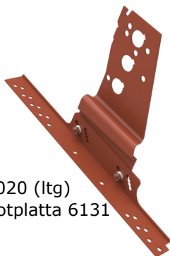
Visar konsol 6020 (ltg) monterad på fotplatta 6131 (råspont)